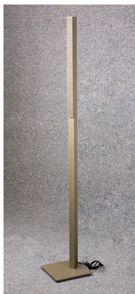
Bild: Stoll Custom Picoline mit Standfuss

Stoll Custom Architectural Loudspeaker Systems werden in Zusammenarbeit mit Kunden, Planern und Architekten optimal evaluiert, um Innenarchitektur und Akustik perfekt zu integrieren. Es gibt diese hochwertigen Systeme aus Schweizer Fertigung für Unterputz, Aufputz und freistehenden oder freihängenden Betrieb, in allen Farben beschichtet oder auch eloxiert.